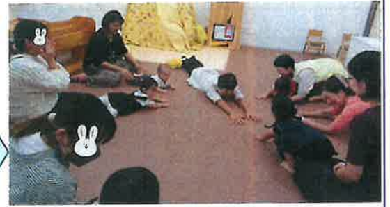
わらべうた「ぎこちよ」を身体を使って楽しみました